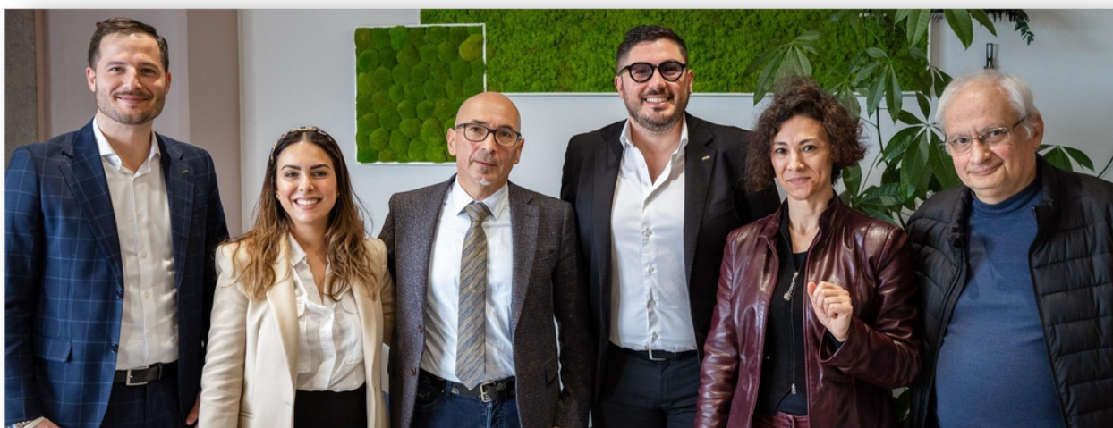
In foto: la direzione dell'Ufficio Scolastico Regionale della Sardegna incontra i rappresentanti dell'azienda MAB&Co. per la sottoscrizione del protocollo di intesa.