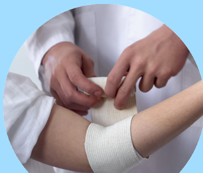
BANDAGES E MEDICATIONS